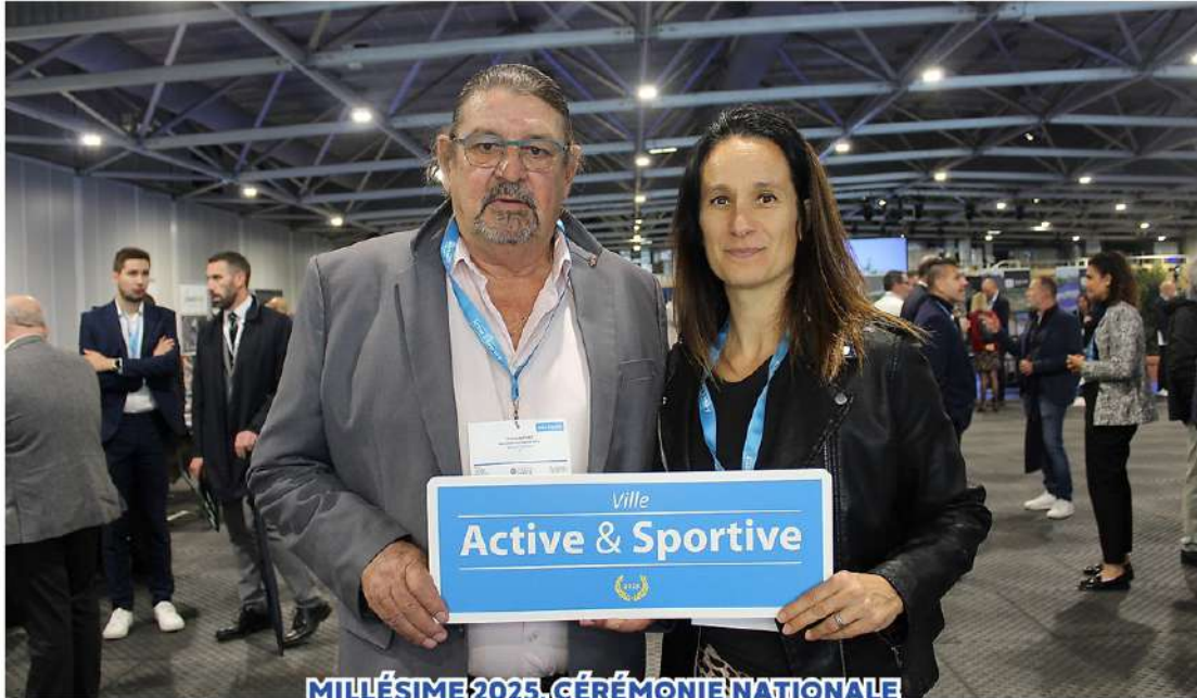
MILLÉSIMÉ 2025, CÉRÉMONIE NATIONALE 30 OCTOBRE 2025, NICE