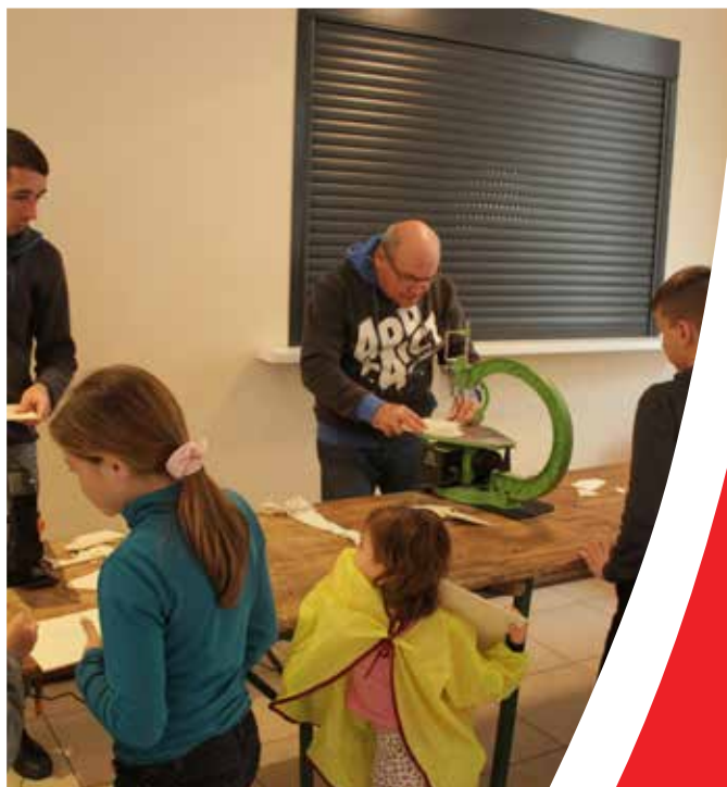
Spectacle « La Reine des Neiges » et atelier bois.

« Sol » - « Yes » - « Pont » = Solliès-Pont