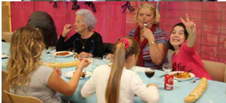
Atelier à la cuisine centrale / Dégustation avec nos aînés à la Salle des Fêtes.